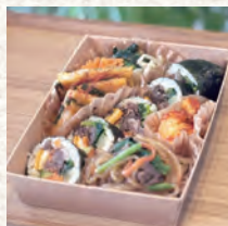
キンパ専門店 88さんの キンパ弁当